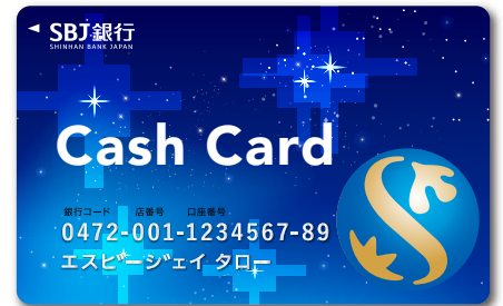
「普通預金プラス」キャッシュカード