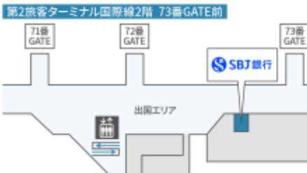
羽田空港第2ターミナル国際線両替所