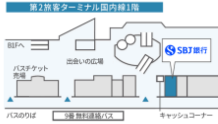
羽田空港第2ターミナル国内線両替所